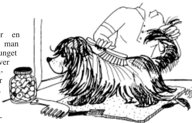
Tegninger: Kirsten Schou-Omak

Malteser eller en Collie, skal man ikke have sprunget pelsplejen over ret mange gange, før man står med en filtret, uglejet og trist hund, som det vil blive særdeles svært - og dyrt - at få tilbage til et naturligt og velplejet udseende.