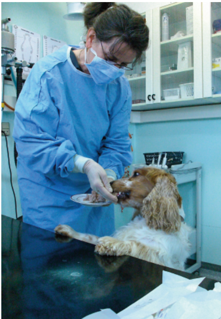
Cashew får en kemo-pille i leverpostej.

Igen kan man vælge at undlade nogen form for behandling. Ingen operation, smertestillende medicin eller anden form for behandling. Bare nyde de gode dage og sige far-