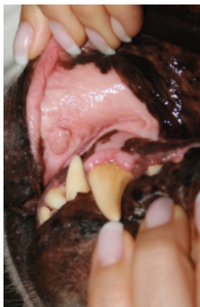
Så lille blev knuden efter kemo-behandlingen.