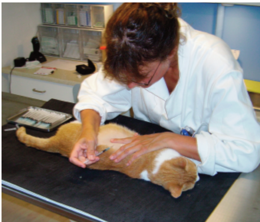
Allergitest på kat, hvor der sprøjtes forskellige allergener ind. Vi mennesker kalder den priktesten, og på os udføres den på underarmens inderside.