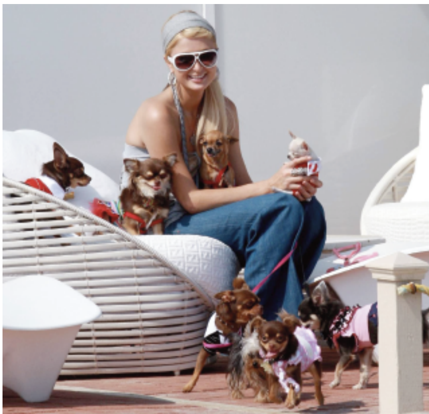
Paris Hilton har inspireret mange unge piger til at anskaffe sig en "taskehund".

sige "Nej tak", selvom man næsten ikke kan nænne det, for at stoppe de forhold, hvalpene må lide under. Og det er vigtigt at sikre sig, at man får en hund, der har fået en god opvækst.