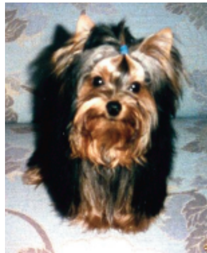
Luffe er bestemt heller ikke en taskehund!