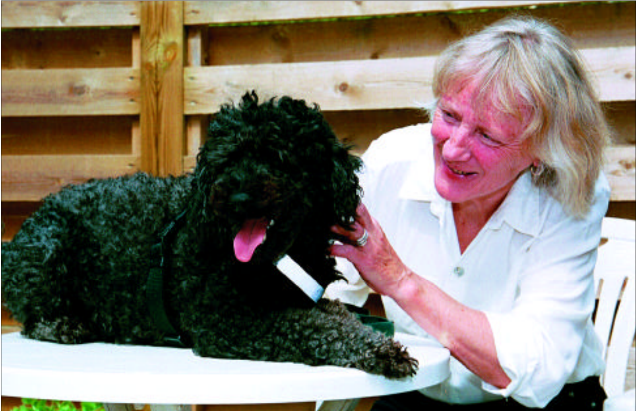
Vaks, min nuværende adoptivhund.

”Bare en hund”, er der mennesker, der siger. Er det ”bare”, at et andet liv slutter sig til mit, at en hale klapper i gulvet af glæde ved at høre min stemme, at en snude fortroligt stikker sig ind i min hånd, at to øjne røber mig verdener af tillid og hengivenhed.