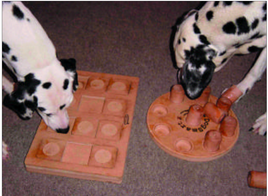
Eksempel på trælegetøj der giver hunden udfordring.

Der er sikkert mange flere ting. Det er kun fantasien, der sætter grænser. Tingene skal bare ikke kunne ødelægges.