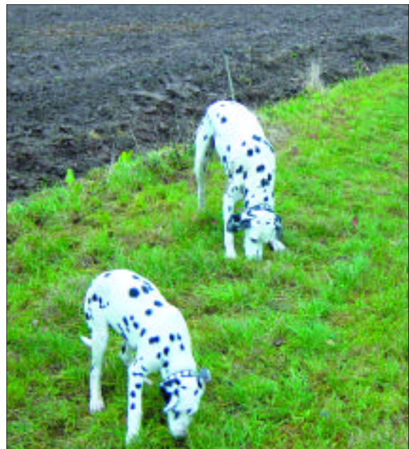
Lad hunden bruge sin næse.